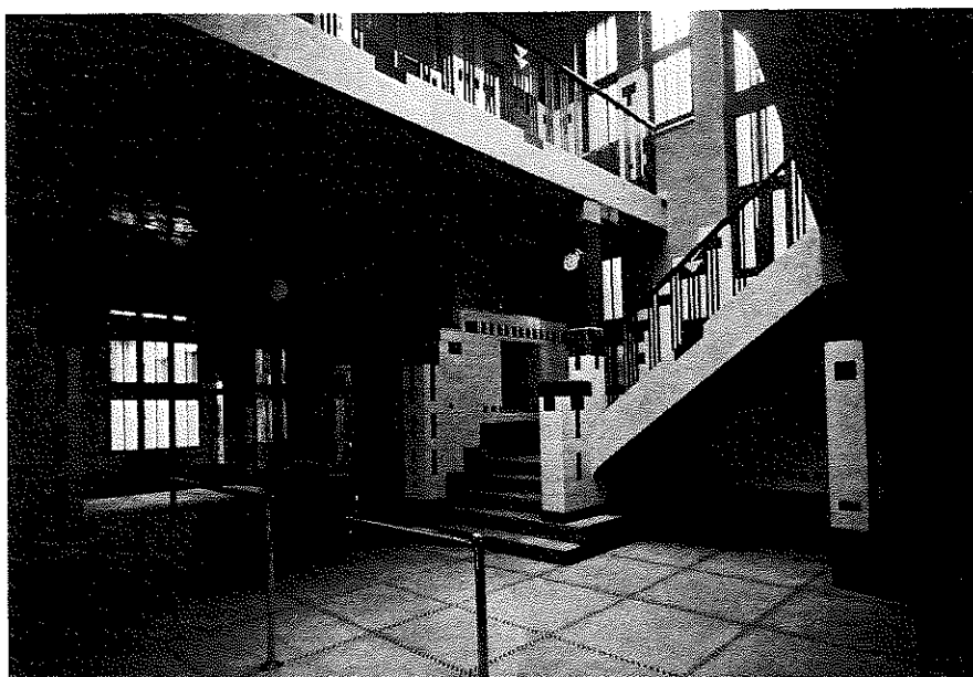
Clinique « Bond Moyson » à Gand, ca. 1929. Photographie d'époque.