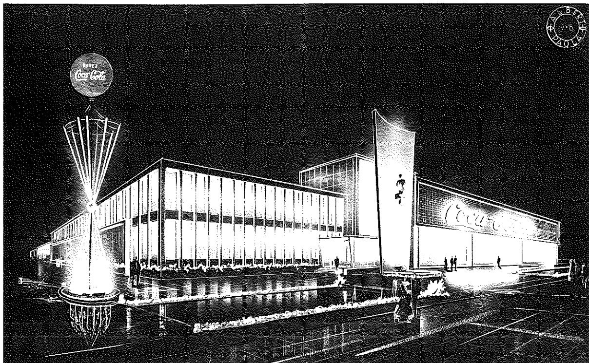
Concours pour le siège de la société Coca-cola, 1959. Gouache et pastels sur papier noir. 744 × 1098.