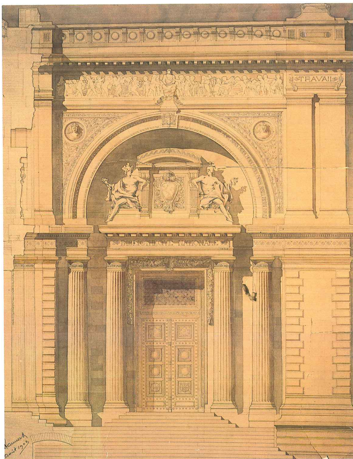
Joseph Van Neck. Projet de bibliothèque publique, 1 er prix au concours Godecharle, 1903. Encre de Chine, crayon noir et lavis sur papier fort, 1020 x 800.