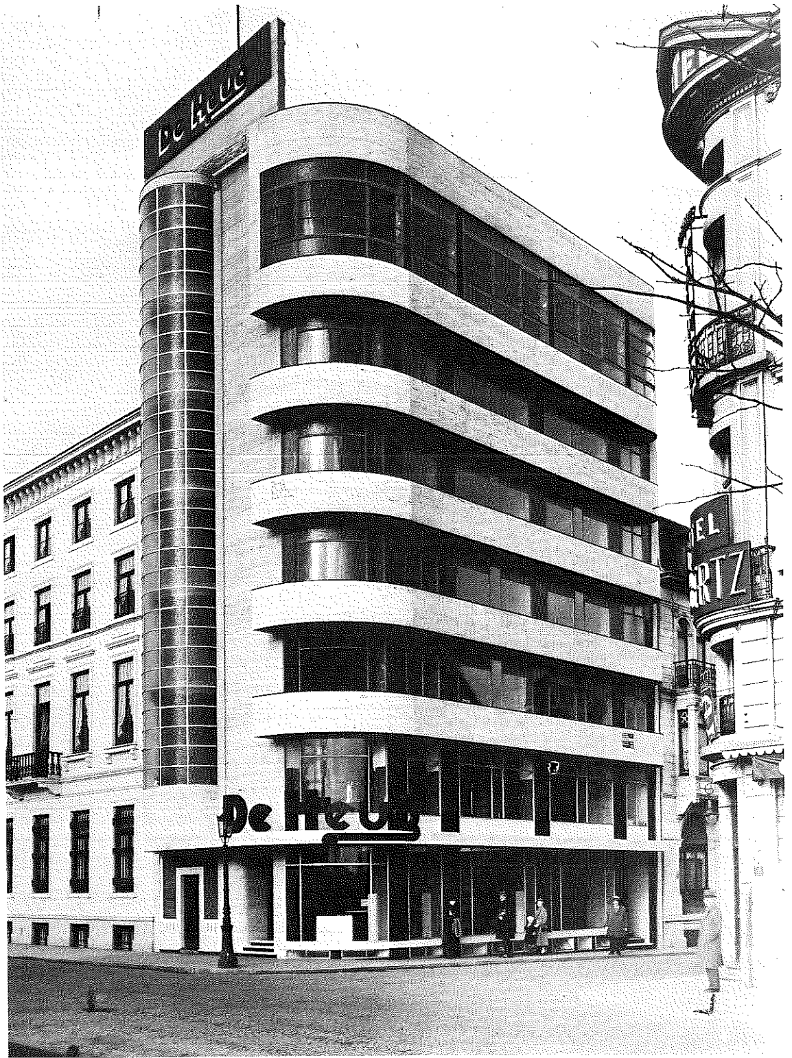
Immeuble commercial et locatif à Charleroi pour la firme de pianos De Heug, 1933. Photographie d'époque.