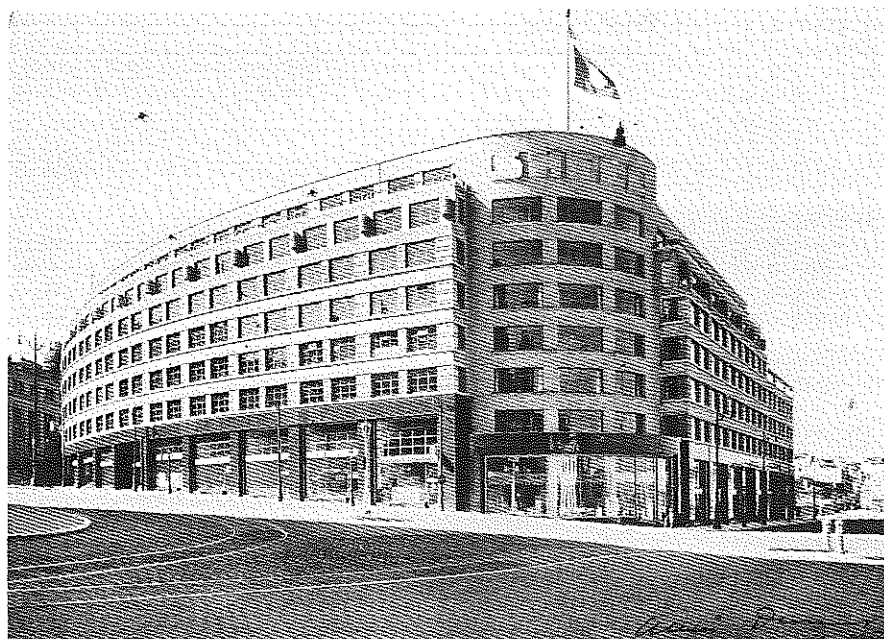
« Shell Building », rue Ravenstein et rue Cantersteen à Bruxelles, 1933 : façade rue Cantersteen et vue générale du bâtiment. Reproduction d'une photographie d'époque.