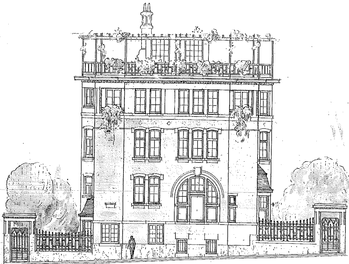
Fernand De Pape. Projet de villa pour Mme Fivet, avenue des Villas à Forest (Bruxelles) (collaborateur G. Verlant), 1921, (fragment). Tirage sur papier rehaussé à l'aquarelle, 590 x 810.