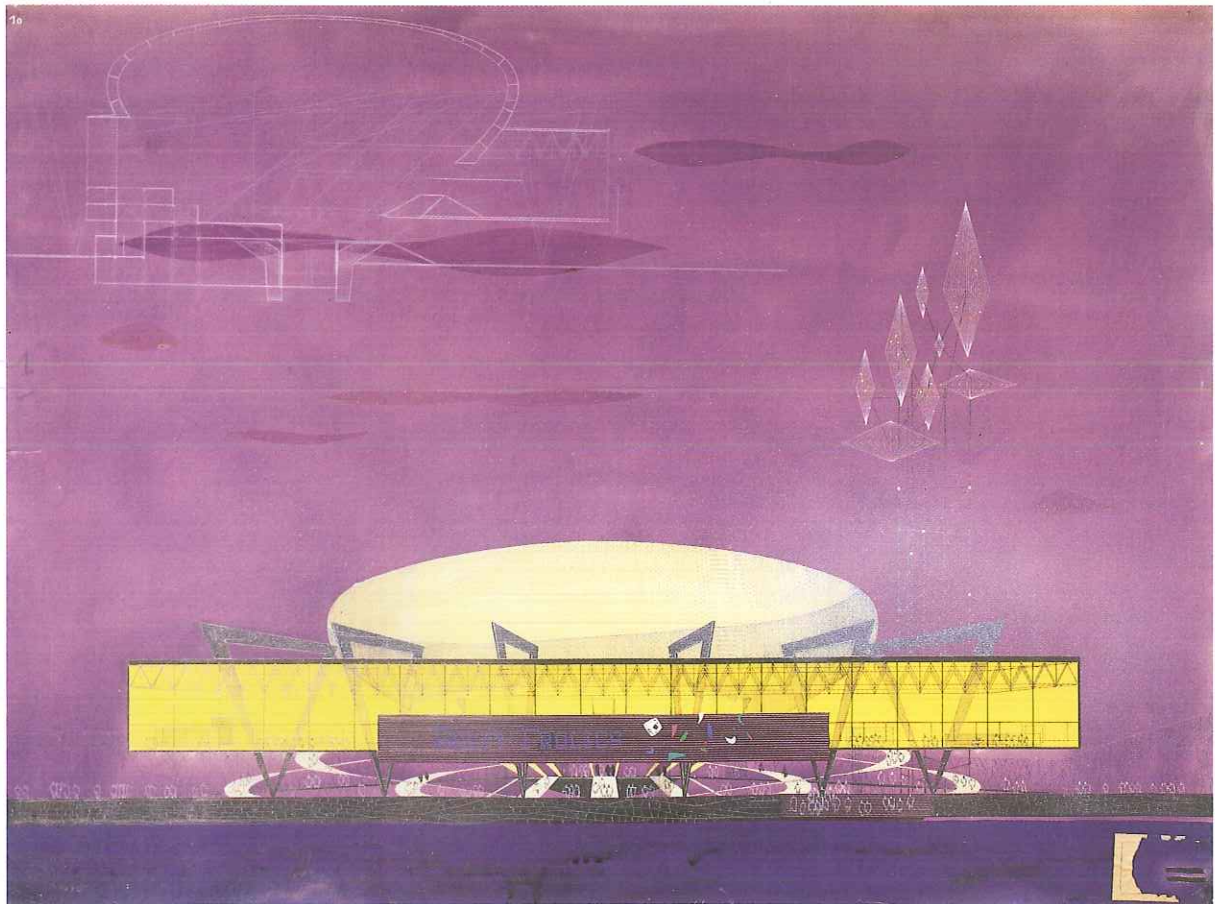
Charles De Meutter. Projet pour un music-hall Rooty Frolics, École nationale supérieure des beaux-arts de Paris (atelier O. Zavaroni), vers 1952. Encre de Chine, crayon noir et gouache sur papier fort, 1235 x 1635.