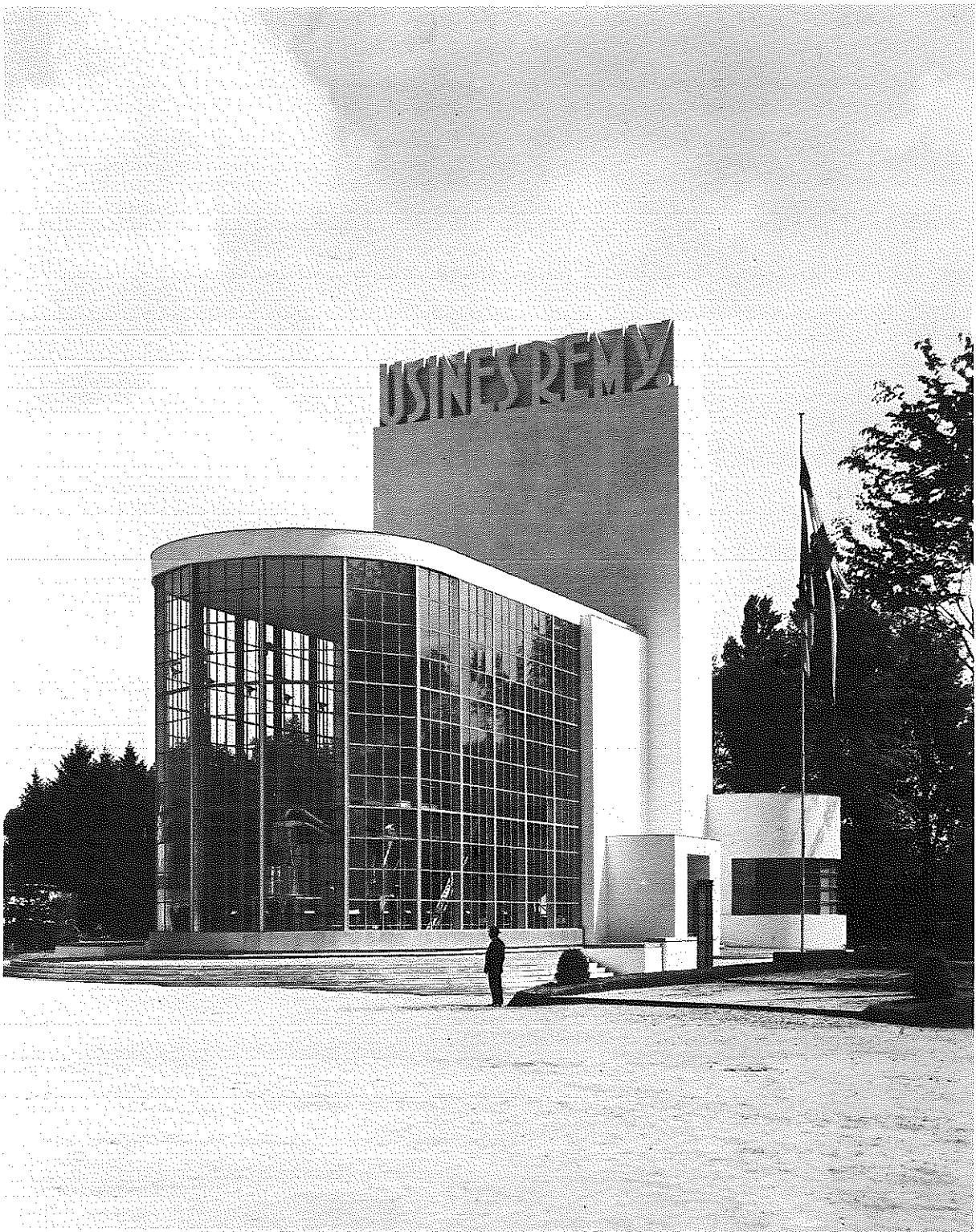
Pavillon des usines Remy à l'Exposition Universelle de Bruxelles en 1935.