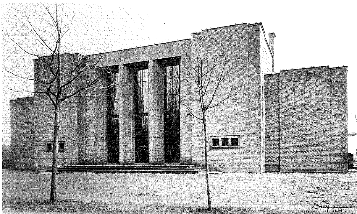
Salle des fêtes et dispensaire des Usines Remy à Wygmael, 1933.

Jean De Ligne a lui-même détruit la plus grande partie de ses archives. Parmi les 31 documents graphiques originaux conservés par le Musée, une dizaine seulement concernent la réalisation de maisons particulières. L'essentiel du fonds est constitué de carnets de croquis datant d'avant la première guerre mondiale et de dessins aquarellés (églises et chapiteaux romans) réalisés d'après nature en 1918.