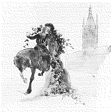
Illustration d'un manuscrit rédigé par J. De Ligne en 1918. Aquarelle sur papier. 218 x 343.