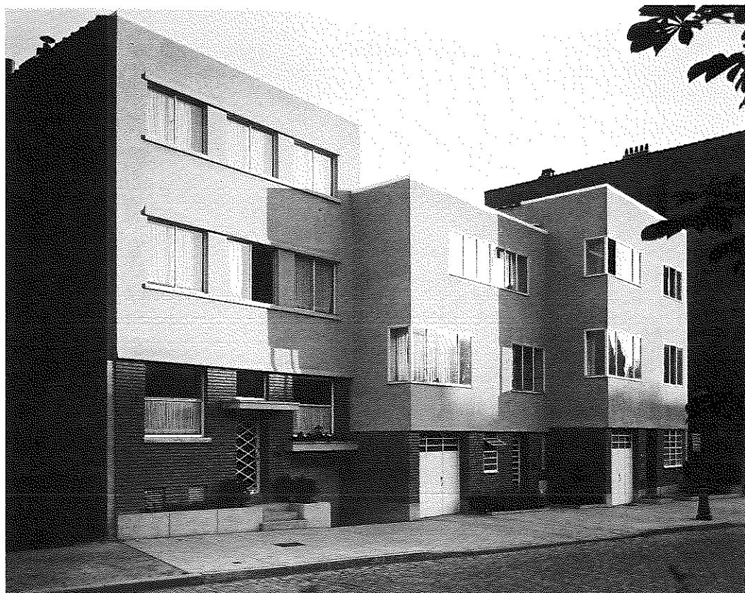
Groupe de trois maisons, avenue des Clématites à Bruxelles, 1932. Prix Van de Ven 1935.

La plus grande partie des archives de Charles Colassin à été détruite. Le Musée conserve une quarantaine de documents graphiques relatifs à quelques projets exécutés entre 1925 et 1935. Parmi ceux-ci, des perspectives et une dizaine de gouaches, notamment des études chromatiques réalisées à partir d'un même dessin.